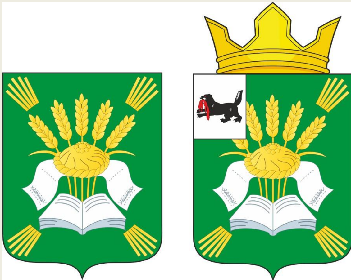
Герб Ширяевского муниципального образования (примеры воспроизведения в цвете)