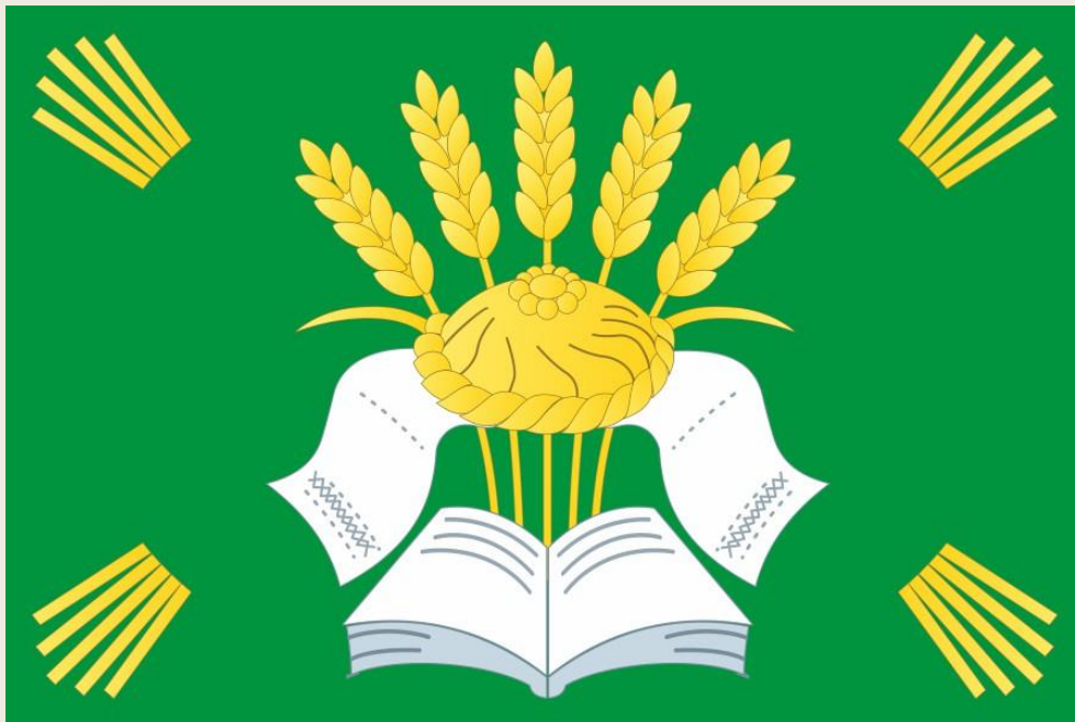
Флаг Ширяевского муниципального образования (цветное изображение)